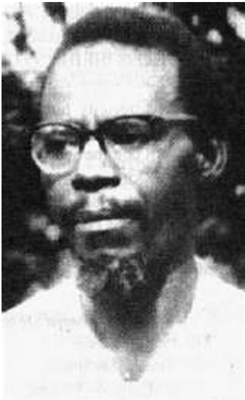
Hon. Paul MIREREKANO