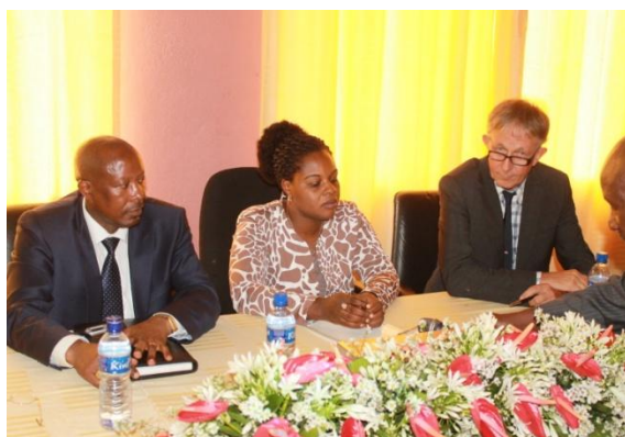
Mot de circonstance/ouverture officielle