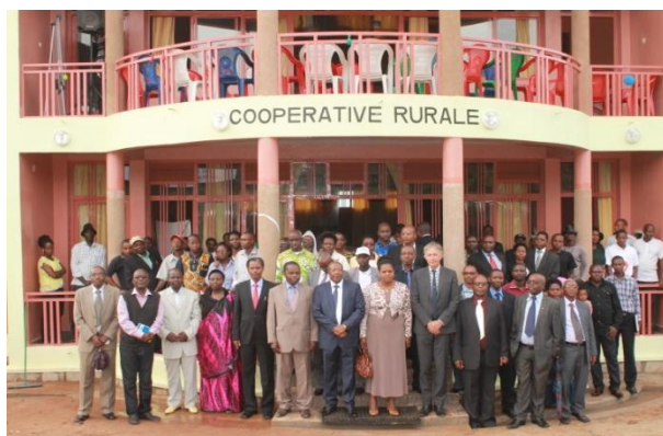
Photo de famille