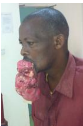
Le patient avant l'opération