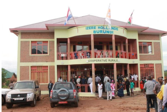
Bureaux Izere-Hollande + Coopérative Rurale

Profitant de son séjour au pays, le président d'IZERE-Hollande a, en date du 26 Novembre 2014, procédé à l'inauguration officielle d'un bâtiment qui abrite le Siège social d'IZERE au Burundi, une Coopérative de production (Copo-Rurale) ainsi qu'une Boulangerie visant l'amélioration des conditions socio-économiques de la population notamment en contribuant à l'autosuffisance alimentaire.